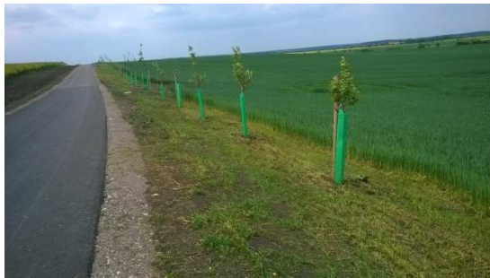
Márgenes de carreteras