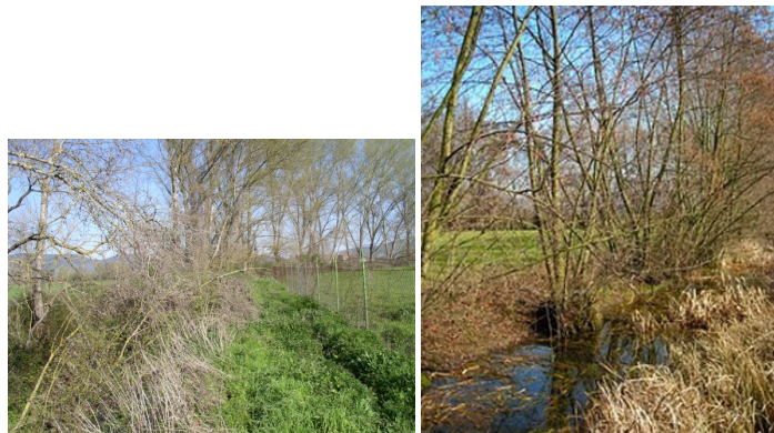
Limpieza del cauce