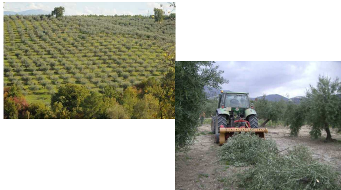
Viñedos y olivos