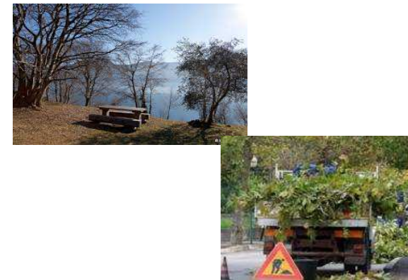
Parques y jardines