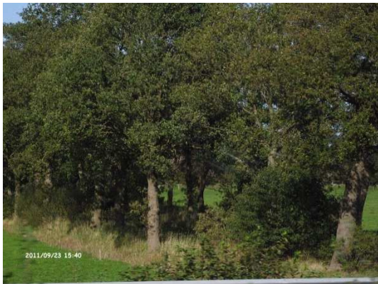
Alineaciones de árboles en bancales antiguos de separación de campos)