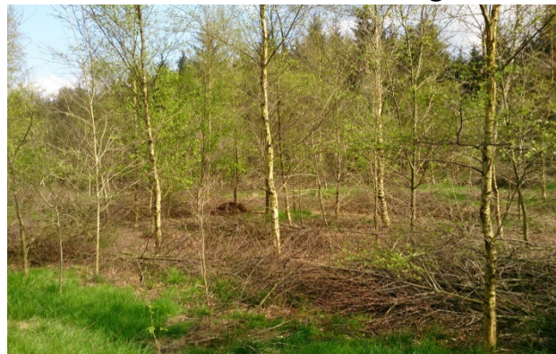
Eliminación de especies forestales en pantanos para disminuir el drenaje