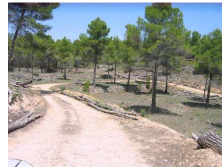
Camino, fajas auxiliares y cortafuegos