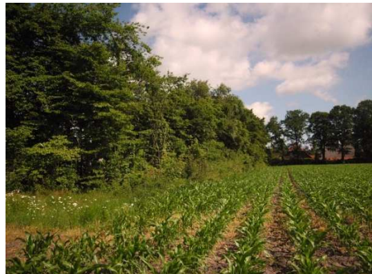
Alineaciones de árboles en márgenes de campos de cultivo