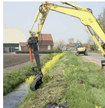
Márgenes de carreteras